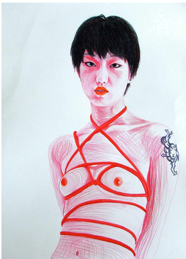
Frédéric Léglise, « Juning », 2014, crayons de couleur sur papier, 77 X 56 cm.