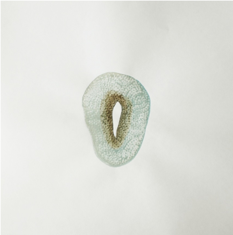
Julie Navarro, sans titre, série « Par la fente », 2013, dessin à l'aquarelle, 37 x 37 cm.