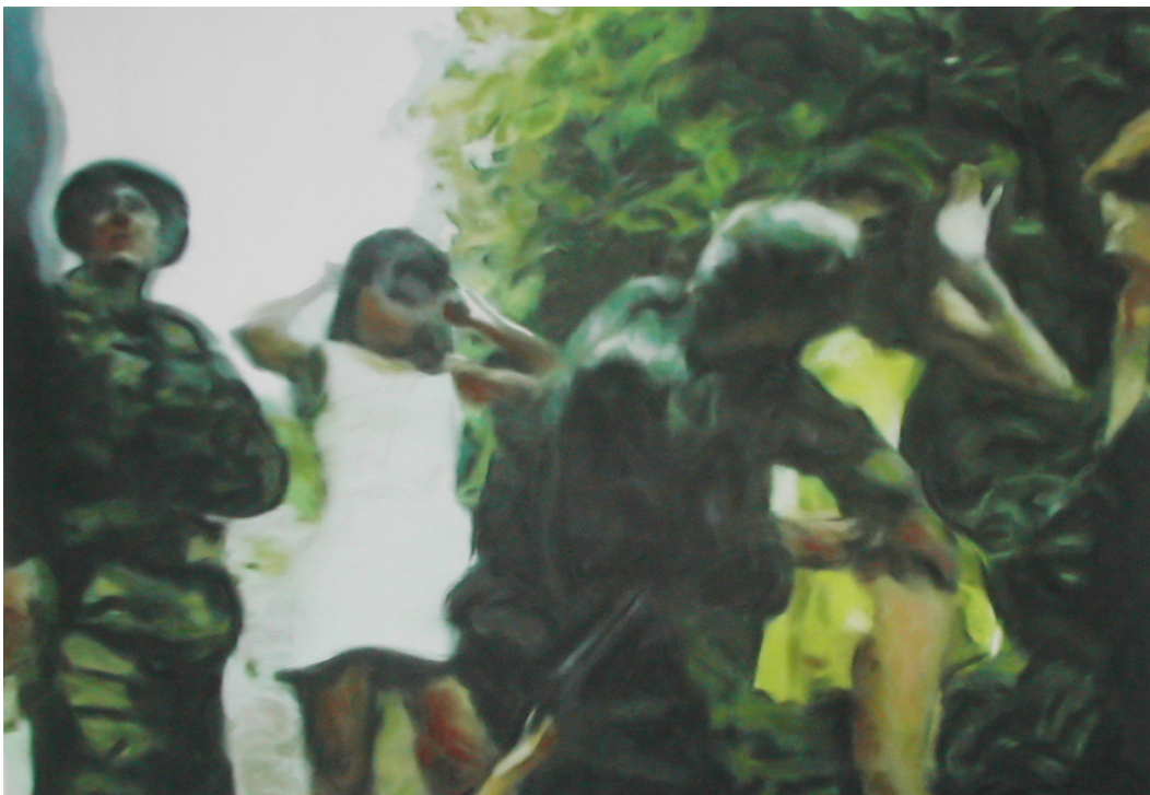
Laurent Bouckenoghe, « Fouille au corps », 2006, pastel sur papier, 100 x 70 cm.