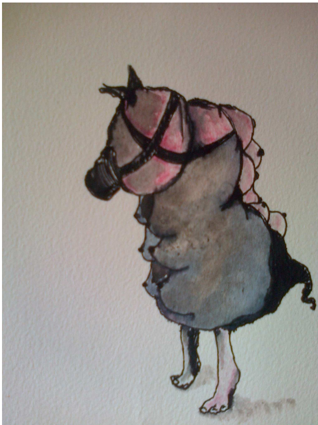
Julie Perin, sans titre, 2014, 18 x 20 cm.