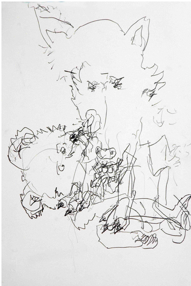
Alberto Sorbelli, « L'extase de Vénus », 2009, Mine de plomb sur papier, 60 x 45 cm.