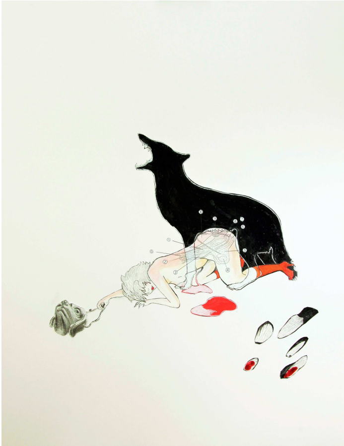
Tamina Beausoleil, « F.S. n° 31 », 2012, technique mixte sur papier, 50 x 65 cm.