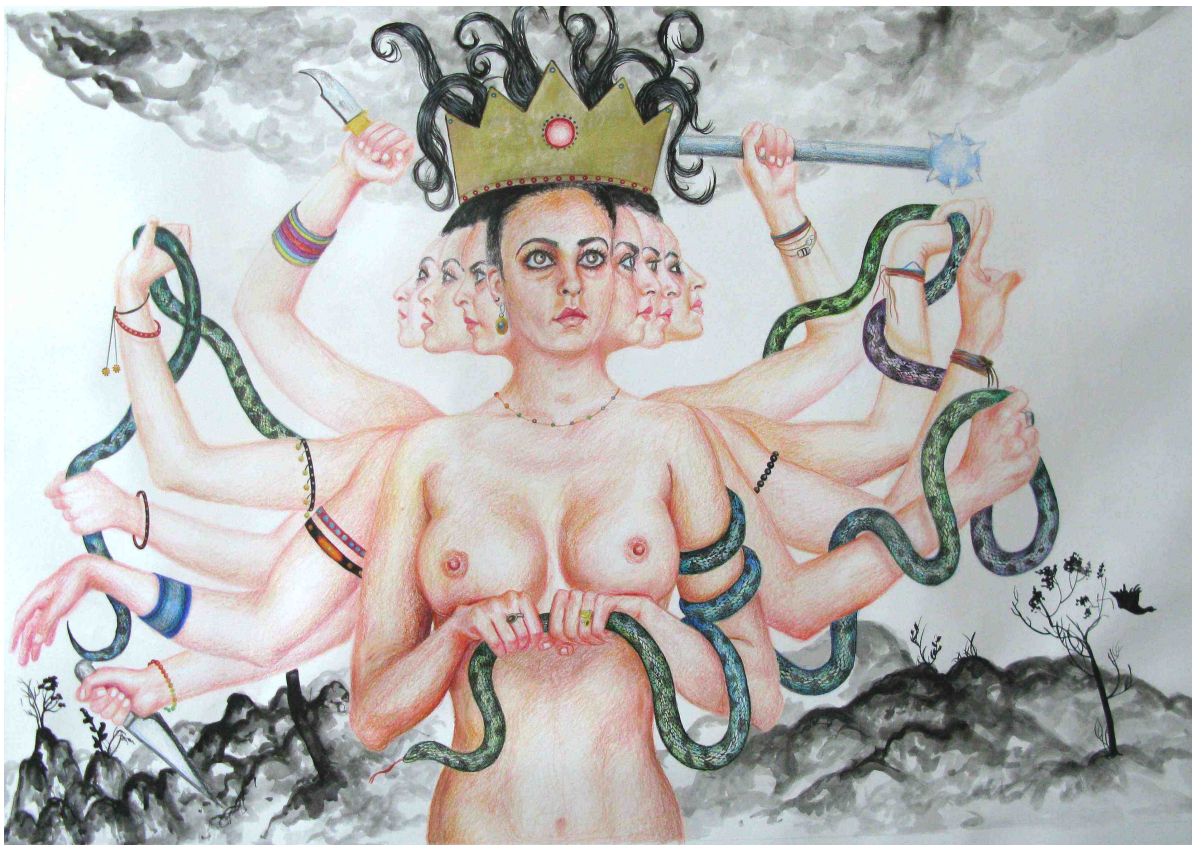
Nazanin Pouyandeh, sans titre, 2012, dessin mixte sur papier, 70cm x 100cm.