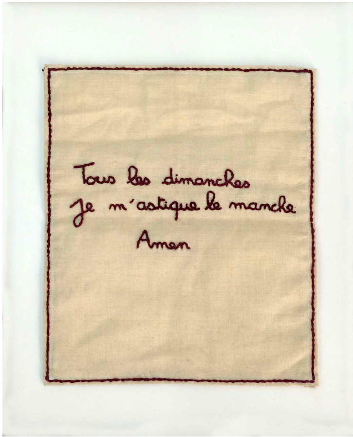
Eric Pougeau, broderie, 18 x 20 cm.