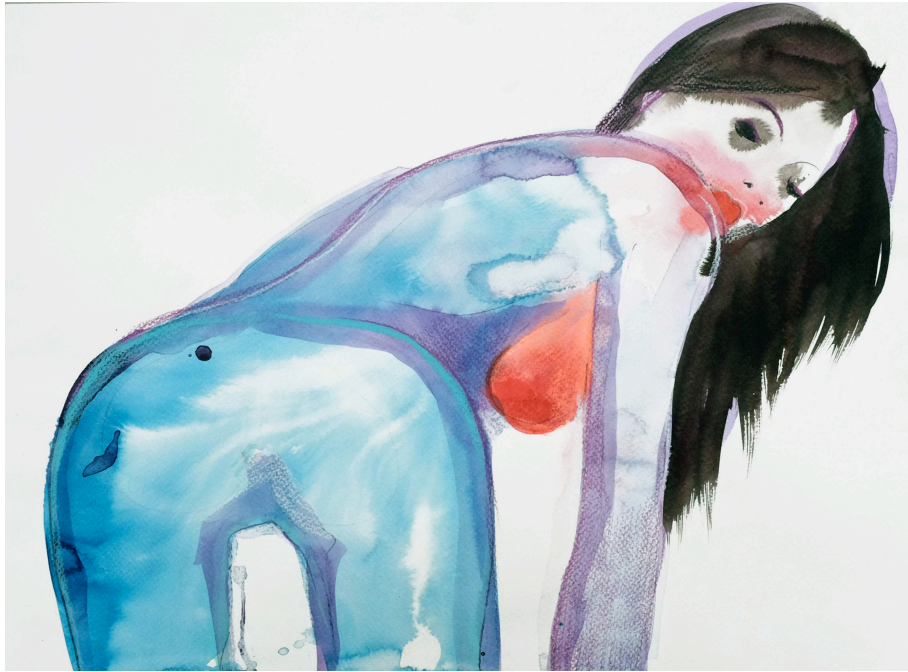
Alice Sfintesco, « Salo 4 », 2014, technique mixte sur papier, 32 x 42 cm.